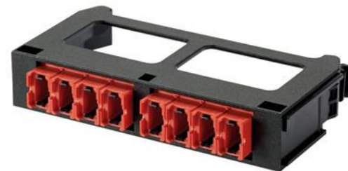
SFQシリーズ対応 MPO光ファイバーアダプタ