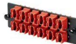
FAPシリーズ対応 MPO光ファイバーアダプタ