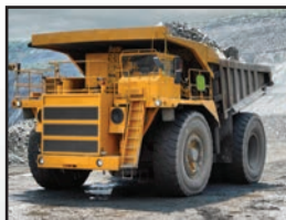
ダンプ、ごみ収集車、 コンクリートミキサー、 作業トラックなどの 特殊トラック